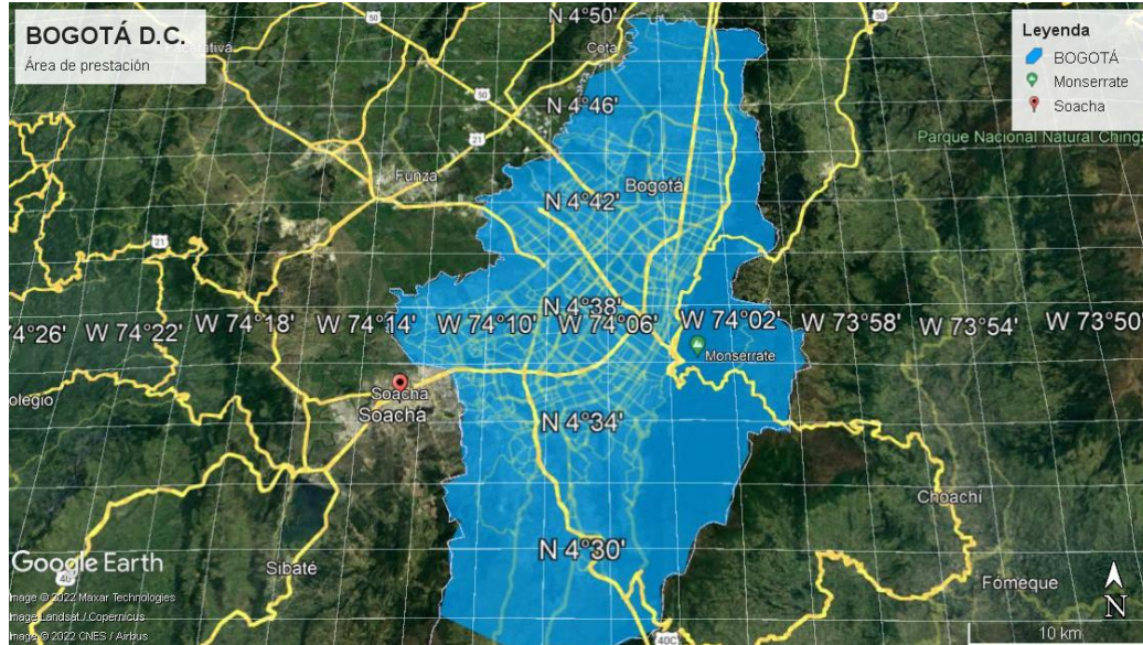
Ilustración 1 Área de prestación Bogotá

Cláusula 8. Publicidad. La persona prestadora de la actividad de aprovechamiento deberá publicar de forma sistemática y permanente, en su página web, la siguiente información para conocimiento del suscriptor y/o usuario: